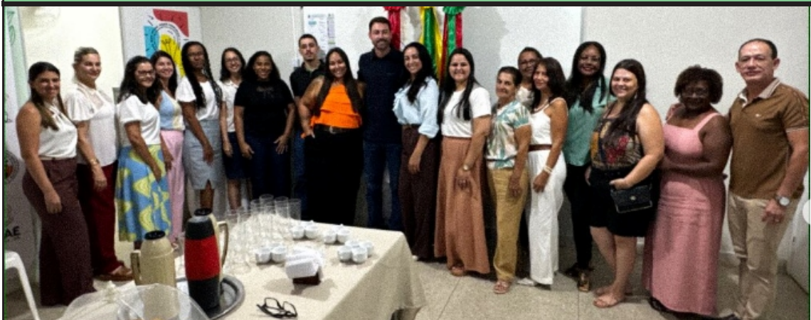
A Secretaria Municipal de Educação de Mantena realizou a Formação Inicial de Gestores Escolares da rede municipal, com o tema “Gestão Escolar com foco no planejamento, resultados e acolhimento”. O encontro reuniu diretoras escolares para troca de experiências, reflexões e formação sobre liderança e gestão escolar.