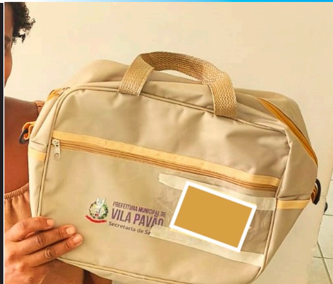
Prefeitura de Vila Pavão fortalece rede de apoio com entrega de kits para grávidas O cadastro e a avaliação inicial são realizados pelos Agentes Comunitários de Saúde (ACS), que conhecem a realidade de cada família