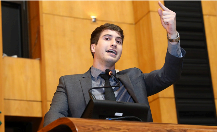
O parlamentar defende a competência

O deputado Lucas Polese (PL) quer dar uma segunda chance aos alunos que ficam reprovados no exame prático da carteira de motorista. Segundo proposta protocolada por ele, caso não passem de primeira, eles ficarão isentos de pagar qualquer taxa na segunda tentativa. Na justificativa do Projeto de Lei (PL) 224/2025, Polese argumenta que “esta isenção contribuirá com aquele que está dependendo da emissão da sua primeira CNH para conquistar uma nova vaga de emprego, assumir um cargo público, entre outros inúmeros sonhos e realizações que trazem benefícios para a economia e para a sociedade”.